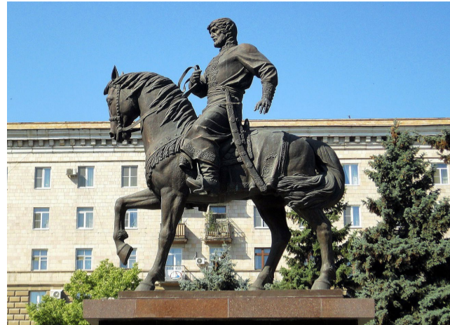
Памятник воеводе Григорию Засекину в Волгограде.